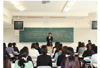
女性の方も多く参加されています